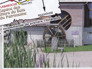
Parc de jeux

Ouvert d'avril à mi-octobre de 9h à 12h et de 14h à 18h sauf le lundi Groupe sur réservation jusqu'à fin octobre